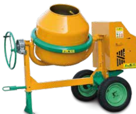
MOD. S 360 - TYPE S 14 E