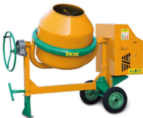
MOD. S 360 - TYPE S 14 i