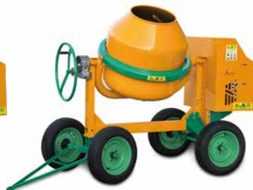
MOD. S 360 - TYPE S 14 A